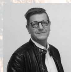
Юрген Ейзен Генеральний директор конференції